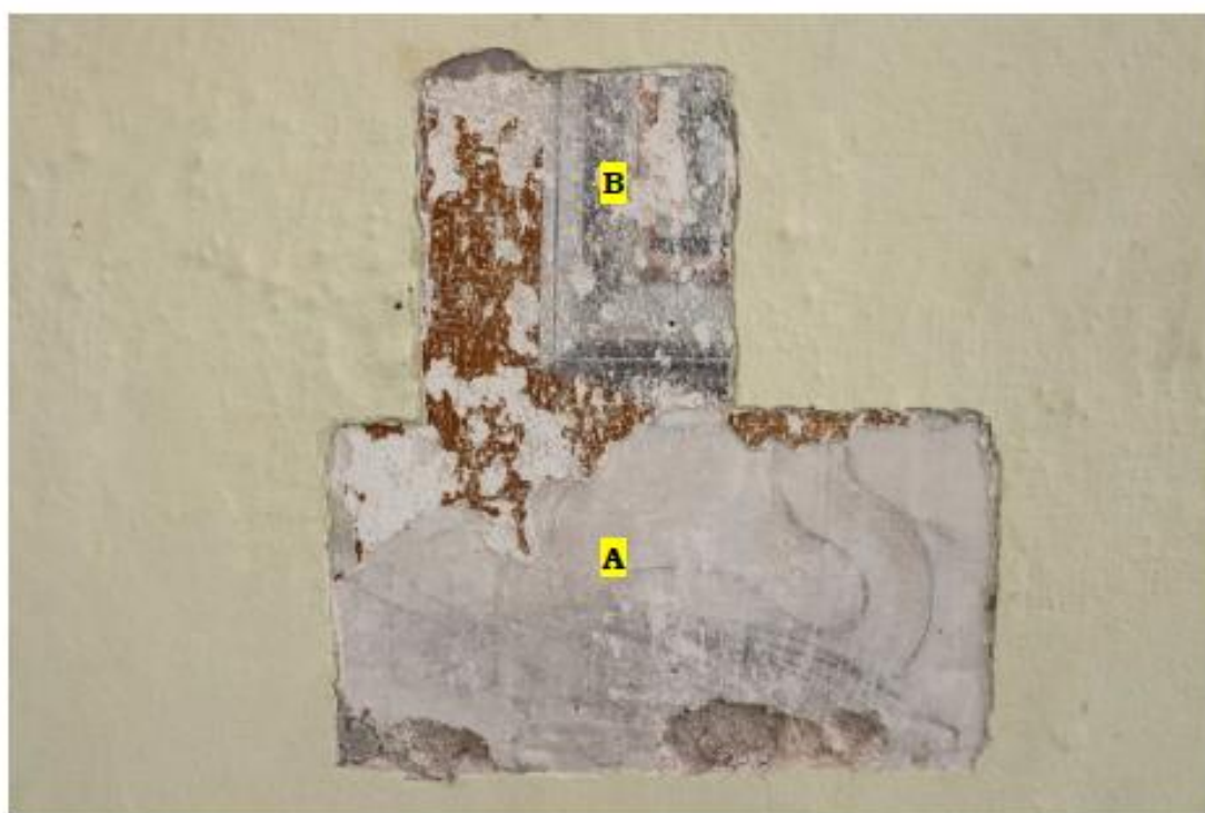
A - Kresba, B – fragmenty jednoduchého rámování ploch mezi okny, zcela nesoudržné s podkladem