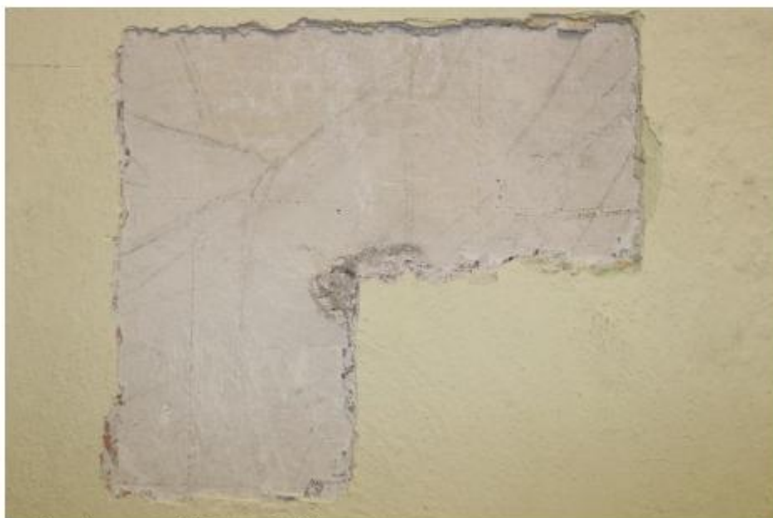
Podkresba na ryté čtvercové síti